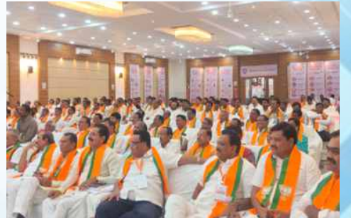
बुधवार, दि.२७ मे २०२६ रोजी | वेळ: दुपारी १:२८ | ठिकाण: नांदेड दक्षिण जिल्हा