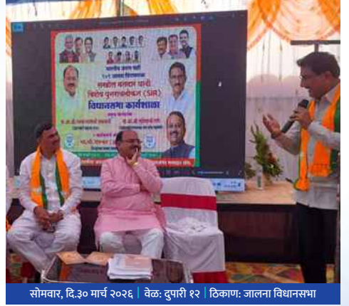
सोमवार, दि.३० मार्च २०२६ | वेळ: दुपारी १२ | ठिकाण: जालना विधानसभा