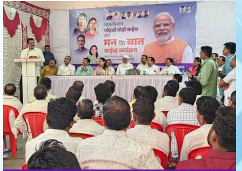
रविवार, दि.२६ एप्रिल २०२६ | वेळ: दुपारी १२.४१ | ठिकाण: केज (बीड)