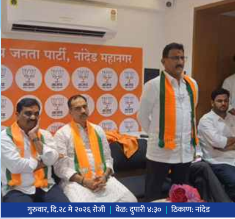
गुरुवार, दि.२८ मे २०२६ रोजी | वेळ: दुपारी ४:३० | ठिकाण: नांदेड