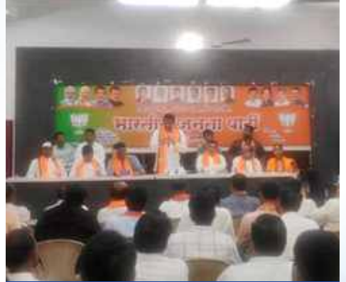
शनिवार, दि.१४ मार्च २०२६ | वेळ: रात्री ८.०० | ठिकाण: जालना - महानगर व ग्रामीण