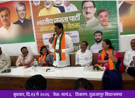
बुधवार, दि.१३ मे २०२६ | वेळ: सायं.६ | ठिकाण: तुळजापूर विधानसभा