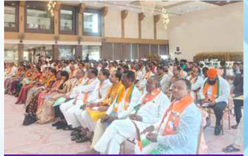
गुरुवार, दि.२८ मे २०२६ रोजी | वेळ: दुपारी १:२७ | ठिकाण: नांदेड उत्तर जिल्हा