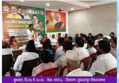
बुधवार, दि.१३ मे २०२६ | वेळ: सायं.६ | ठिकाण: तुळजापूर विधानसभा