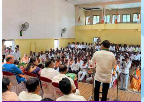
बुधवार, दि.१३ मे २०२६ | वेळ: दुपारी २ | ठिकाण: भूम-परंडा-वाशी विधानसभा