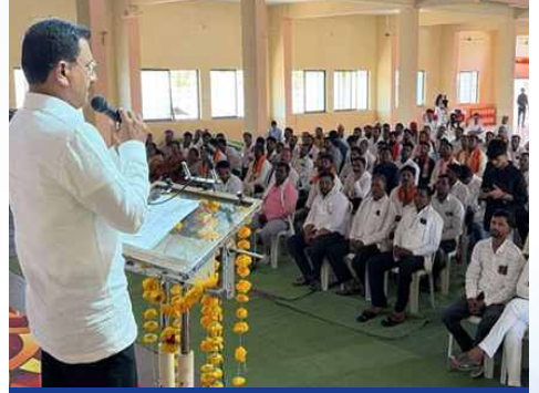
शनिवार, दि.२ मे २०२६ | वेळ: दुपारी १.२७ | ठिकाण: नांदेड दक्षिण