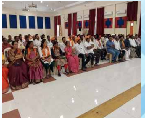
शनिवार, दि.२१ मार्च २०२६ | वेळ: दुपारी १२.३० | ठिकाण: संगमनेर (अहिल्यानगर)