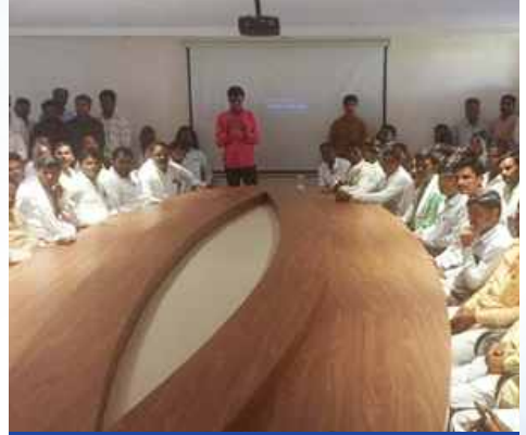
मंगळवार, दि.३१ मार्च २०२६ वेळ: दुपारी १२.३० ठिकाण: घनसावंगी विधानसभा (जालना)