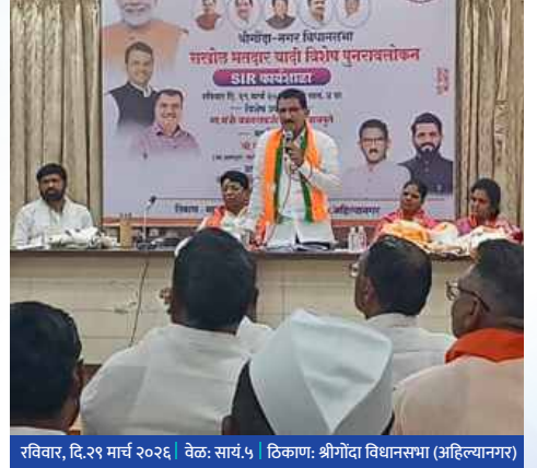
रविवार, दि.२९ मार्च २०२६ | वेळ: साय.५ | ठिकाण: श्रीगोंदा विधानसभा (अहिल्यानगर)