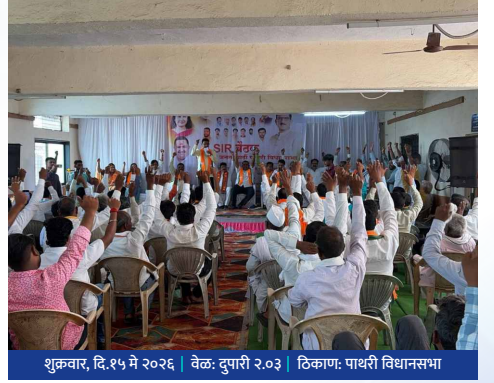
शुक्रवार, दि.१५ मे २०२६ | वेळ: दुपारी २.०३ | ठिकाण: पाथरी विधानसभा