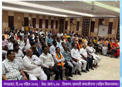
मंगळवार, दि.०७ एप्रिल २०२६ वेळ: सायं.५.२७ ठिकाण: छत्रपती संभाजीनगर (पश्चिम विधानसभा)