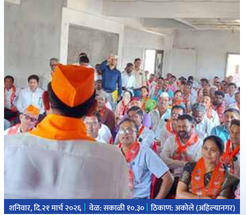
शनिवार, दि.२१ मार्च २०२६ | वेळ: सकाळी १०.३० | ठिकाण: अकोले (अहिल्यानगर)