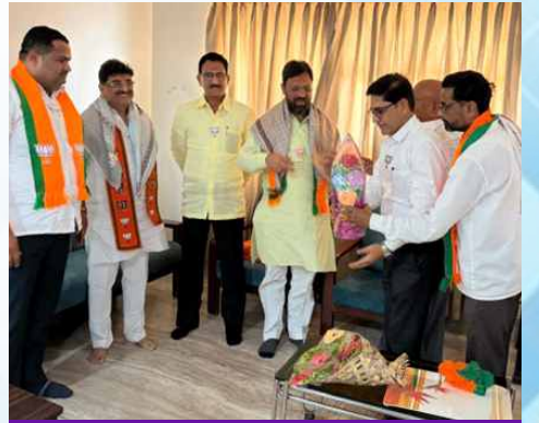
शुक्रवार, दि.१५ मे २०२६ | वेळ: सकाळी ११.०८ | ठिकाण: परभणी विधानसभा