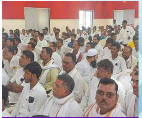
मंगळवार, दि.३१ मार्च २०२६ | वेळ: सकाळी १० | ठिकाण: परतूर विधानसभा (जालना)