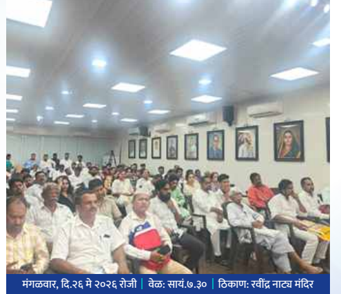
मंगळवार, दि.२६ मे २०२६ रोजी | वेळ: सायं.७.३० | ठिकाण: रवींद्र नाट्य मंदिर