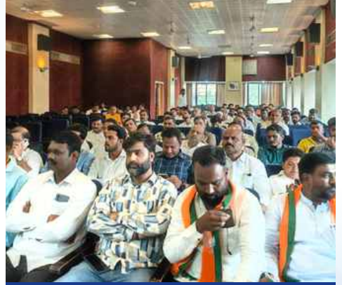
बुधवार, दि.२७ मे २०२६ रोजी | वेळ: सायं.६.३९ | ठिकाण: लातूर