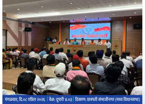
मंगळवार, दि.०८ एप्रिल २०२६ वेळ: दुपारी ४.०३ ठिकाण: छत्रपती संभाजीनगर (मध्य विधानसभा)