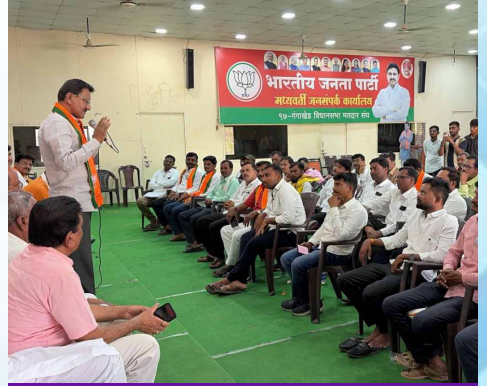
गुरुवार, दि.१४ मे २०२६ | वेळ: दुपारी २-२९ | ठिकाण: गंगाखेड विधानसभा, जिल्हा परभणी