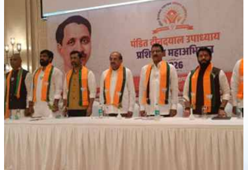
रविवार, दि.२४ मे २०२६ रोजी | वेळ: दुपारी १:२७ | ठिकाण: अहिल्यानगर