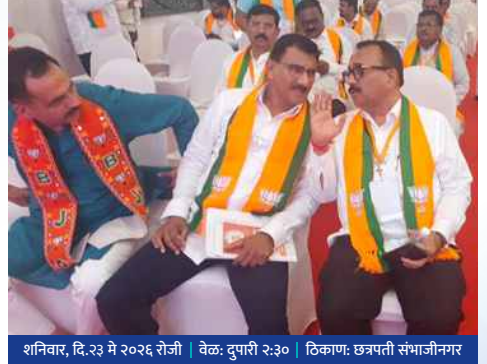
शनिवार, दि.२३ मे २०२६ रोजी वेळ: दुपारी २:३० ठिकाण: छत्रपती संभाजीनगर