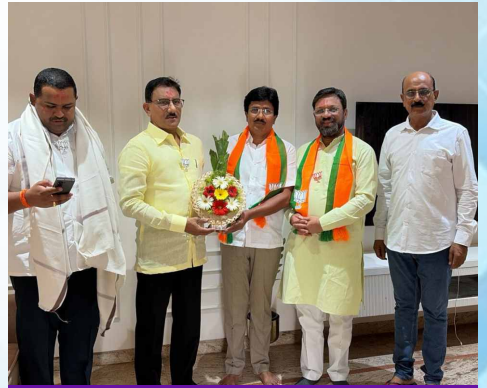
शुक्रवार, दि.१५ मे २०२६ | वेळ: सकाळी ११.०८ | ठिकाण: परभणी विधानसभा