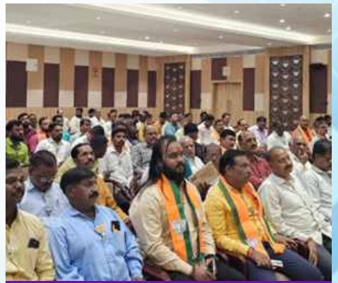
मंगळवार, दि.०८ एप्रिल २०२६ | वेळ: सकाळी ११ | ठिकाण: छत्रपती संभाजीनगर (पूर्व विधानसभा)