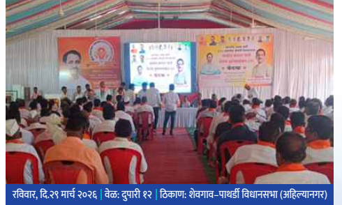
रविवार, दि.२९ मार्च २०२६ वेळ: दुपारी १२ ठिकाण: शेवगाव-पाथर्डी विधानसभा (अहिल्यानगर)