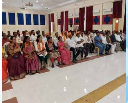
शनिवार, दि.२५ मार्च २०२६ | वेळ: सायं.६ | ठिकाण: कोपरगाव (अहिल्यानगर)