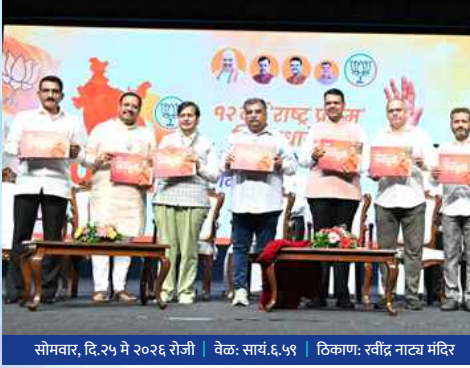
सोमवार, दि.२५ मे २०२६ रोजी | वेळ: सायं.६.५९ | ठिकाण: रवींद्र नाट्य मंदिर