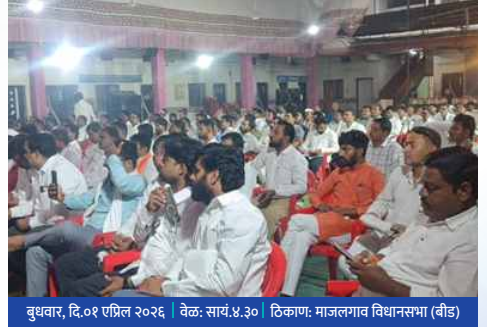
बुधवार, दि.०१ एप्रिल २०२६ | वेळ: सायं. ४.३० | ठिकाण: माजलगाव विधानसभा (बीड)