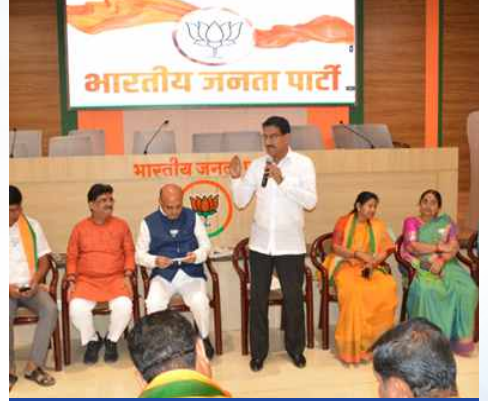
शनिवार, दि.१४ मार्च २०२६ | वेळ: दु.१२.३० | ठिकाण: चिखलठाणा (छत्रपती संभाजीनगर)