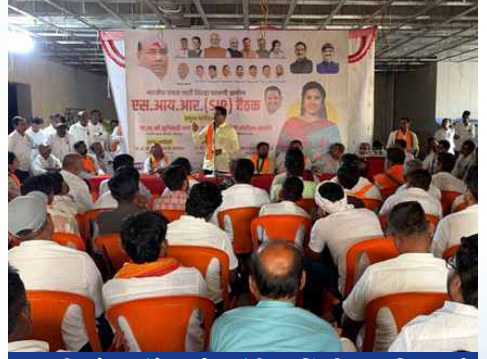
शुक्रवार, दि.१५ मे २०२६ | वेळ: दुपारी १:०० | ठिकाण: जितूर विधानसभा, जिल्हा परभणी