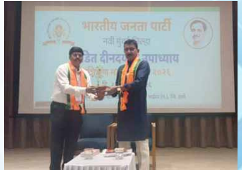
गुरुवार, दि.२१ मे २०२६ रोजी | वेळ: दुपारी १.३४ | ठिकाण: उत्तन येथील रामभाऊ म्हाळगी प्रबोधिनी