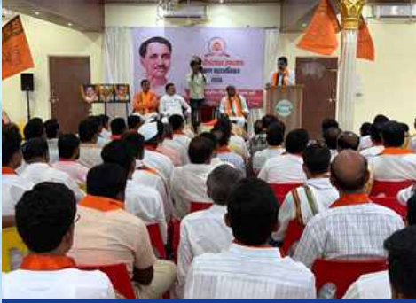
शनिवार, दि.१६ मे रोजी २०२६ | वेळ: रात्री ८.११ | ठिकाण: जालना सावंगी बायपास, छत्रपती संभाजी नगर