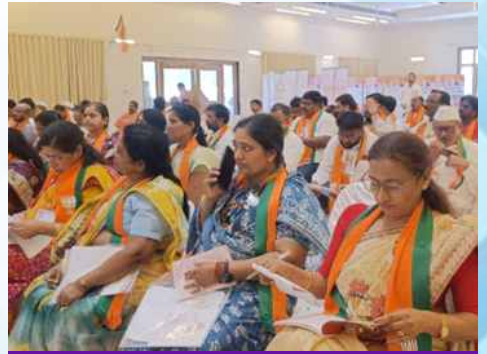
शनिवार, दि.२३ मे २०२६ रोजी वेळ: सायं.४:३१ ठिकाण: छत्रपती संभाजीनगर ग्रामीण (पूर्व)