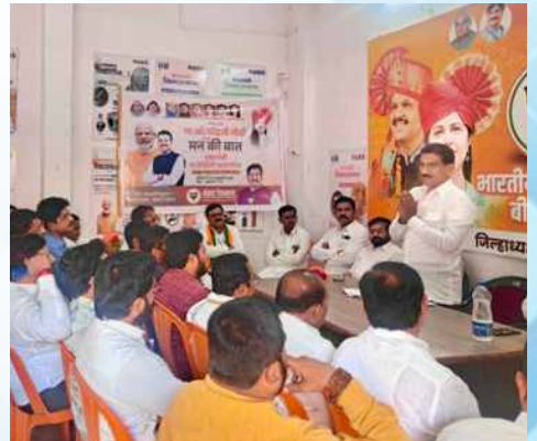
शनिवार, दि.१४ मार्च २०२६ | वेळ: सायं.४.३० | ठिकाण: चिखलठाणा (छत्रपती संभाजीनगर)