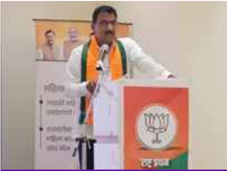
शनिवार, दि.२३ मे २०२६ रोजी वेळ: सायं.४:३१ ठिकाण: छत्रपती संभाजीनगर ग्रामीण (पूर्व)