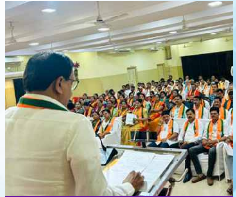
बुधवार, दि.२५ मार्च २०२६ | वेळ: सायं. ५.०० | ठिकाण: रत्नागिरी – दक्षिण