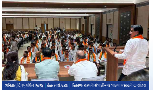
शनिवार, दि.२५ एप्रिल २०२६ | वेळ: सायं.५.४७ | ठिकाण: छत्रपती संभाजीनगर भाजपा मध्यवर्ती कार्यालय