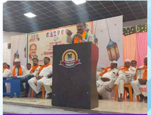
सोमवार, दि.३० मार्च २०२६ | वेळ: सकाळी १० | ठिकाण: बदनापूर विधानसभा (जालना)