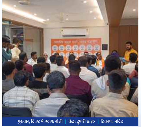
गुरुवार, दि.२८ मे २०२६ रोजी | वेळ: दुपारी ४:३० | ठिकाण: नांदेड