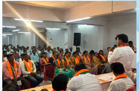
सोमवार, दि.१३ एप्रिल २०२६ | वेळ: सायं.६.२१ | ठिकाण: कन्नड विधानसभा (छत्रपती संभाजीनगर)