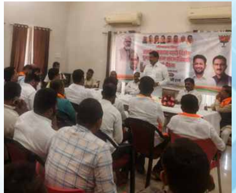
रविवार, दि.१५ मार्च २०२६ | वेळ: दुपारी ३.३० | ठिकाण: चाणक्यपुरी (बीड)