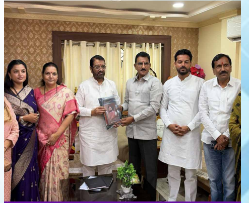
गुरुवार, दि. १४ मे २०२६ | वेळ: सकाळी १०:४९ | ठिकाण: लातूर