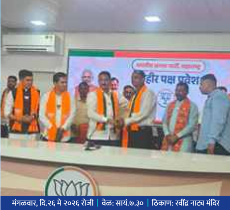
मंगळवार, दि.२६ मे २०२६ रोजी | वेळ: सायं.७.३० | ठिकाण: रवींद्र नाट्य मंदिर