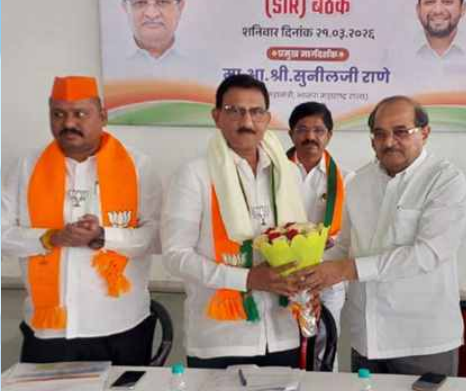
शनिवार, दि.२५ मार्च २०२६ | वेळ: सायं.४ | ठिकाण: राहाता / लोणी विधानसभा (अहिल्यानगर)