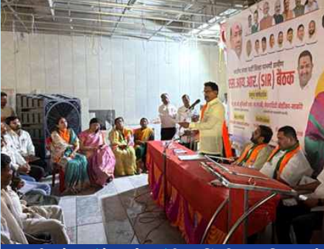
शुक्रवार, दि.१५ मे २०२६ | वेळ: दुपारी १:०० | ठिकाण: जितूर विधानसभा, जिल्हा परभणी