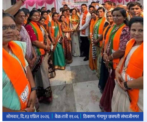
सोमवार, दि.१३ एप्रिल २०२६ | वेळ:रात्री ११.०६ | ठिकाण: गंगापूर छत्रपती संभाजीनगर