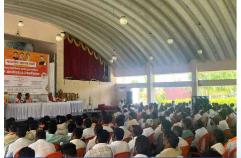
सोमवार, दि.१३ एप्रिल २०२६ | वेळ: दुपारी ३.५५ | ठिकाण: वैजापूर विधानसभा (छत्रपती संभाजीनगर)