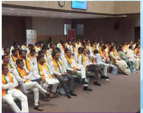
मंगळवार, दि.२६ मे २०२६ रोजी | वेळ: दुपारी १२:४० | ठिकाण: बीड