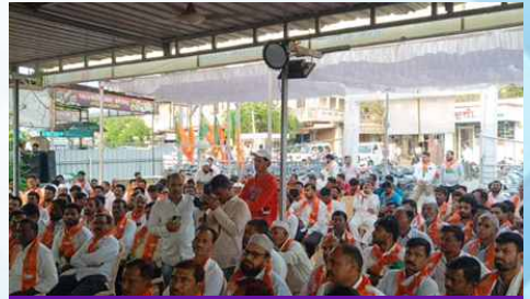
मंगळवार, दि.३१ मार्च २०२६ वेळ: सायं.४ ठिकाण: गेवराई विधानसभा (बीड)