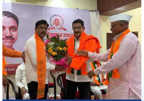
शुक्रवार, दि.१५ मे २०२६ | वेळ: दुपारी १.०० | ठिकाण: जितूर विधानसभा, जिल्हा परभणी