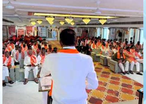
शनिवार, दि.१६ मे रोजी २०२६ | वेळ: दुपारी १२:४३ | ठिकाण: हिंगोली