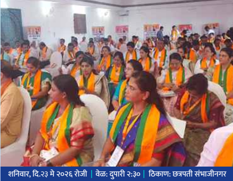
शनिवार, दि.२३ मे २०२६ रोजी वेळ: दुपारी २:३० ठिकाण: छत्रपती संभाजीनगर