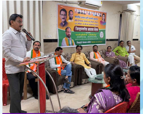
गुरुवार, दि.१४ मे २०२६ | वेळ: सायं.६:३० | ठिकाण: परभणी विधानसभा