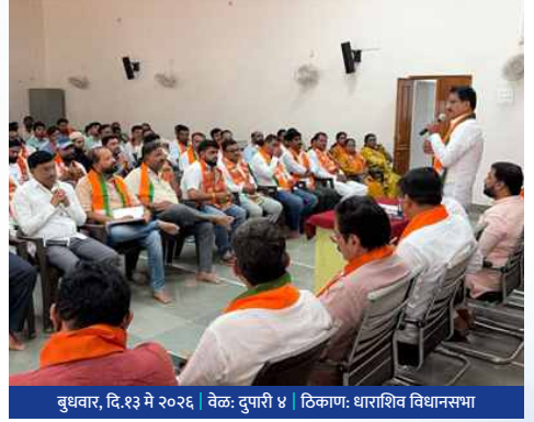
बुधवार, दि.१३ मे २०२६ | वेळ: दुपारी ४ | ठिकाण: धाराशिव विधानसभा