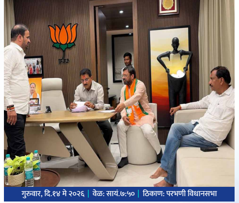
गुरुवार, दि.१४ मे २०२६ | वेळ: सायं.७:५० | ठिकाण: परभणी विधानसभा