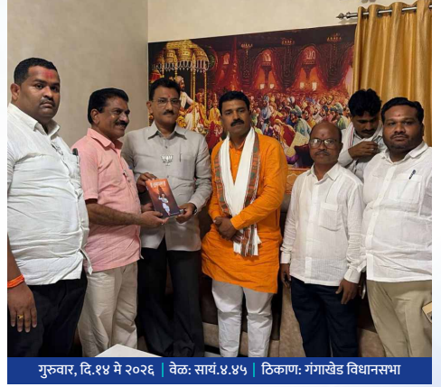
गुरुवार, दि.१४ मे २०२६ | वेळ: सायं.४.४५ | ठिकाण: गंगाखेड विधानसभा