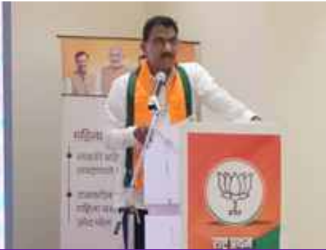
रविवार, दि.२४ मे २०२६ रोजी | वेळ: दुपारी २:०१ | ठिकाण: अहिल्यानगर उत्तर