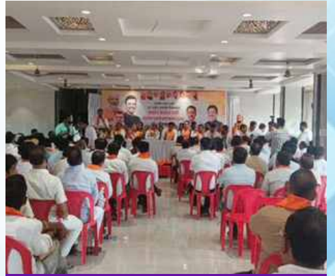
रविवार, दि.२९ मार्च २०२६ वेळ: दुपारी ३ ठिकाण: कर्जत-जामखेड विधानसभा (अहिल्यानगर)