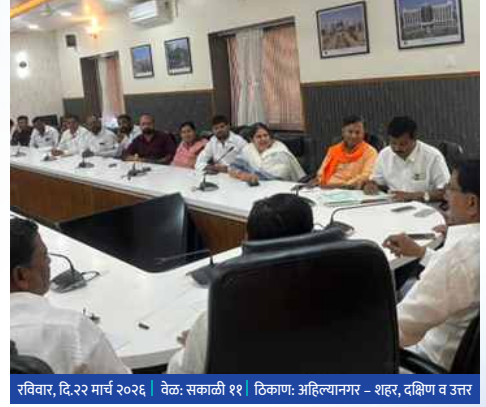
रविवार, दि.२२ मार्च २०२६ | वेळ: सकाळी ११ | ठिकाण: अहिल्यानगर – शहर, दक्षिण व उत्तर