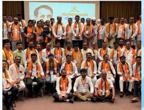
सोमवार, १ जून २०२६ रोजी | वेळ: रात्री १०:३१ | ठिकाण: उत्तन येथील रामभाऊ म्हाळगी प्रबोधिनी