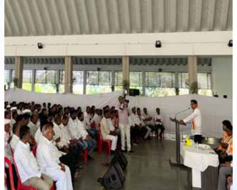
शनिवार, दि.२५ मार्च २०२६ | वेळ: सायं.४ | ठिकाण: राहाता / लोणी विधानसभा (अहिल्यानगर)