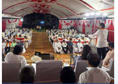
बुधवार, दि. १३ मे २०२६ | वेळ: रात्री ११:०० | ठिकाण: उमरगा, जि. धाराशिव