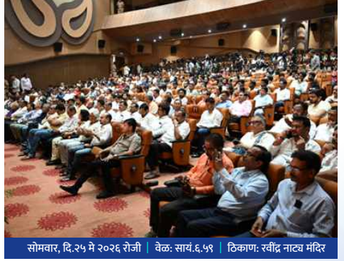
सोमवार, दि.२५ मे २०२६ रोजी | वेळ: सायं.६.५९ | ठिकाण: रवींद्र नाट्य मंदिर