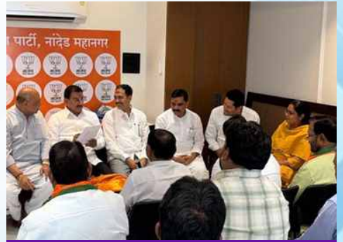
शनिवार, दि.२ मे २०२६ | वेळ: सकाळी १०.५३ | ठिकाण: नांदेड दक्षिण