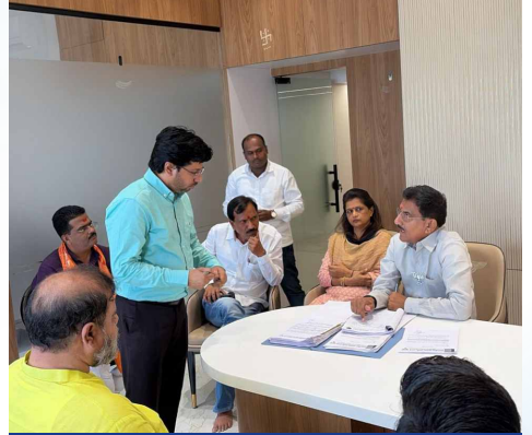
गुरुवार, दि.१४ मे २०२६ | वेळ: सकाळी ११-२७ | ठिकाण: भाजप लातूर ग्रामीण कार्यालय