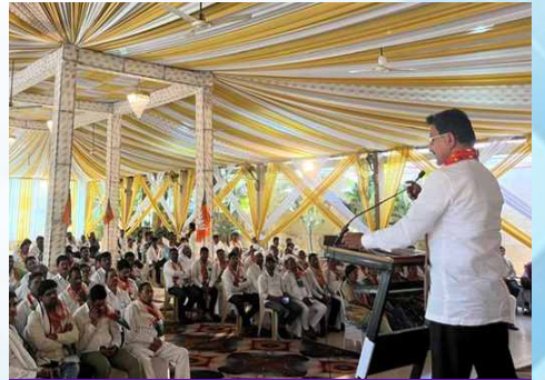
मंगळवार, दि.१४ एप्रिल २०२६ | वेळ: दुपारी ३.१६ | ठिकाण: परळी (बीड)